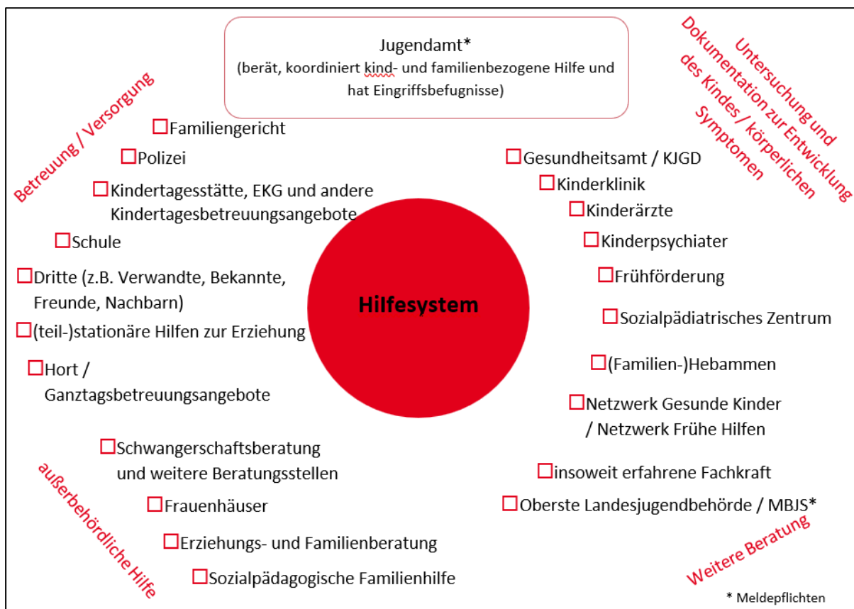
Abbildung: Beteiligte Stellen beim Kinderschutz und Datenaustausch 43

"In das Netzwerk sollen insbesondere Einrichtungen und Dienste der öffentlichen und freien Jugendhilfe, Einrichtungen und Dienste, mit denen Verträge nach § 75 Absatz 3 des Zwölften Buches Sozialgesetzbuch bestehen, Gesundheitsämter, Sozialämter, Gemeinsame Servicestellen, Schulen, Polizei- und Ordnungsbehörden, Agenturen für Arbeit, Krankenhäuser, Sozialpädiatrische Zentren, Frühförderstellen, Beratungsstellen für soziale Problemlagen, Beratungsstellen nach den §§ 3 und 8 des Schwangerschaftskonfliktgesetzes, Einrichtungen und Dienste zur Müttergenesung sowie zum Schutz gegen Gewalt in engen sozialen Beziehungen, Familienbildungsstätten, Familiengerichte und Angehörige der Heilberufe einbezogen werden." 44